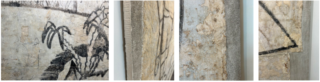
Detalle de los murales tras el proceso de arrancamiento y trasposición al nuevo soporte en la sala del museo. Fotografías: Ana Galán-Pérez.

Universitario de Restauración del Patrimonio de la Universidad Politécnica de Valencia (Soriano, Serra, 2010). En el entorno de las posibilidades existentes, como señalan los autores, el stacco , sería el proceso más idóneo al permitir conservar una parte del muro original, respetando de manera más adecuada la integridad de la obra.