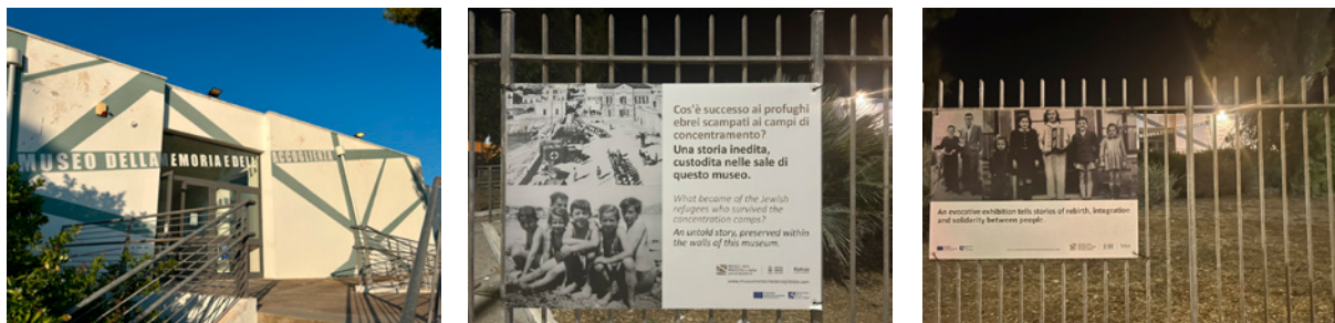
Exterior del museo y paneles informativos.

en torno a la figura de Paolo Pisacane, cronista local y fundador de la asociación APME, Pro-Murales Ebraici, creada en los años ochenta con el objeto de preservar los testimonios visuales e históricos vinculados a este momento vivido en la localidad, siendo él un niño (Pisacane, 2024). Su recuperación y puesta en valor a través del museo llevó al cronista a recopilar toda la información dispersa del campo, creando un corpus documental de referencia (cartas, fotografías y prensa de la época).