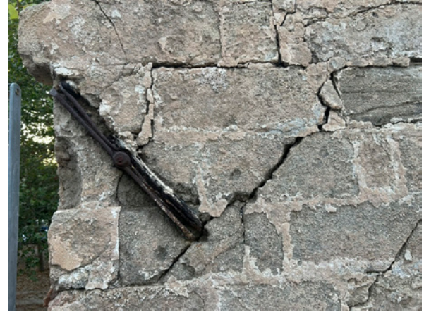
Exterior de la «Casetta del Giardino» en avanzado estado de deterioro, tomadas en 2025.

número 3831, el 26 de marzo de 2003, que, si bien no fue aprobada, contextualizó en un nivel normativo y jurídico el rescate de los murales, sentando las bases para las futuras actuaciones institucionales. 8 Por otro lado, todo el material recopilado de este periodo, custodiado por Pisacane, está protegido y declarado Archivo de Interés Histórico desde 2022 por la Soprintendenza Archivistica e Bibliografica della Puglia. 9