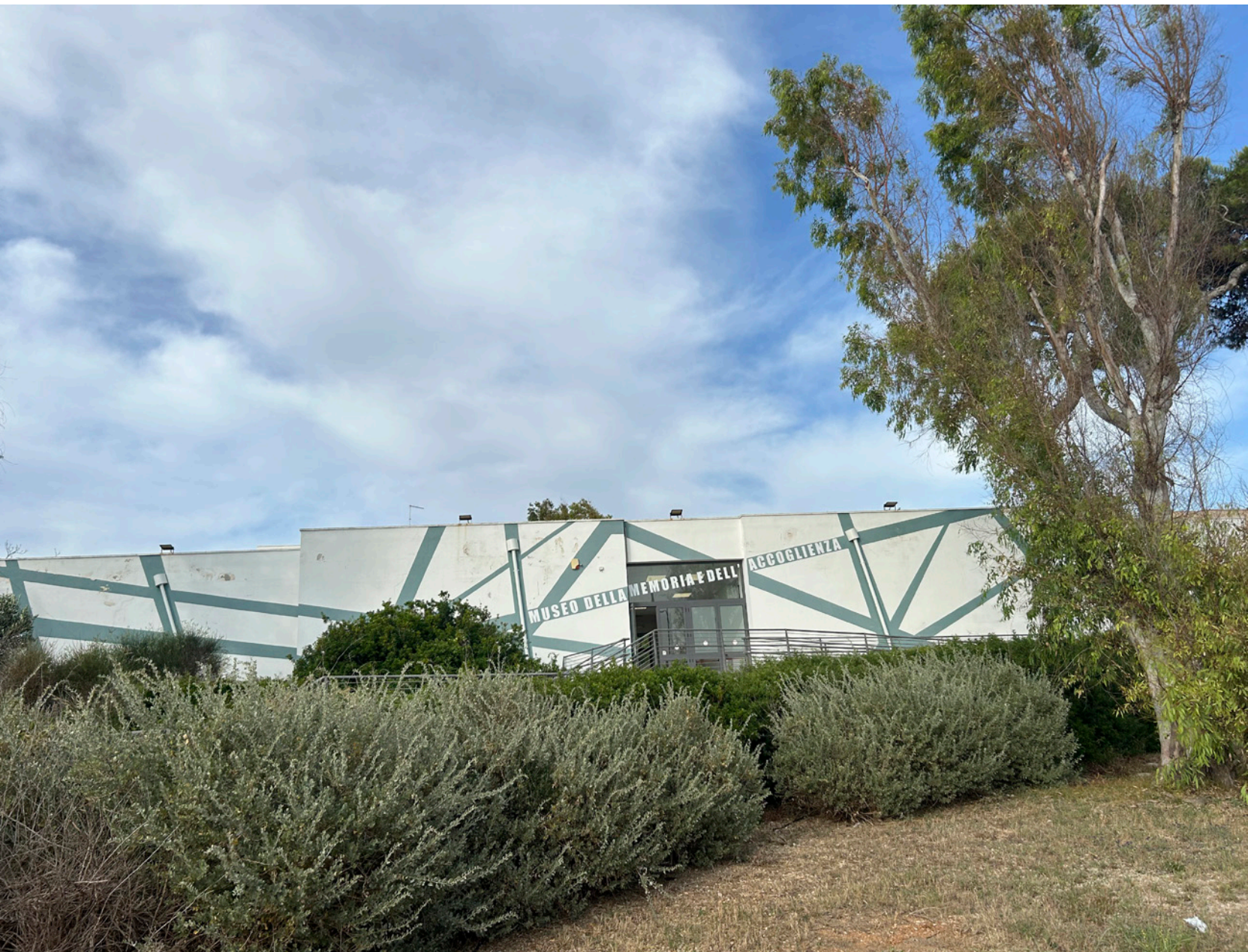
Museo della Memoria e dell'Accoglienza.