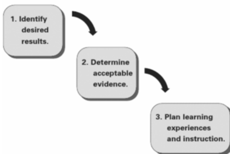
FIG. 2: FASI DELLA PROGETTAZIONE A RITROSO (WIGGING & MCTIGHE, 2007)

Anteponiamo quindi questioni di tipo valutativo alla strutturazione del percorso allo scopo di poterlo traguardare attraverso la progettazione di una serie di attività didattiche.