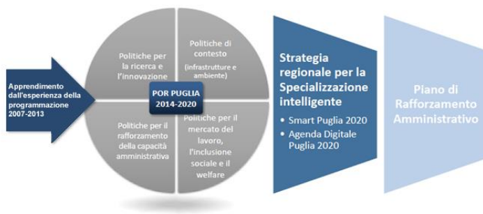
Figura 1 – Por Puglia 2014-2020

Fonte: Rilevazione dati Regione Puglia, 2014.