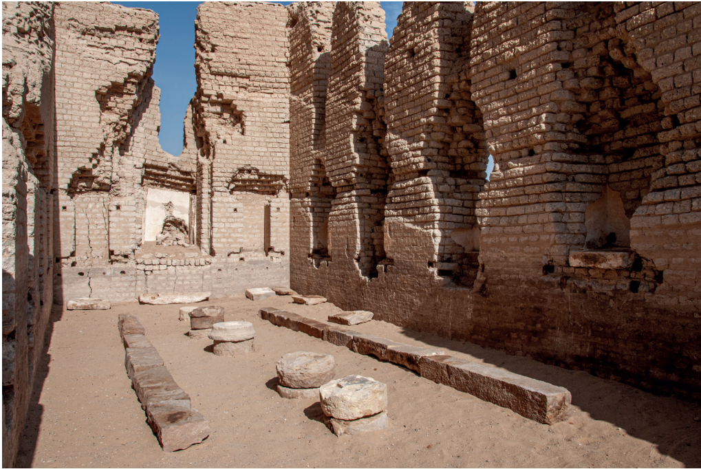
Fig. 5 - Vista della sala da banchetto A in ST 6.

quelle sopra descritte. Nella stessa unità stratigrafica è stato rinvenuto un piccolo dado in osso.