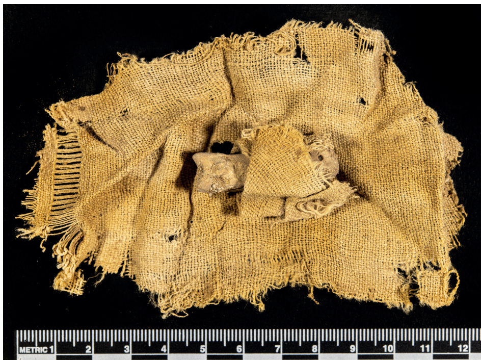
Fig. 3 - Involucro in stoffa contenente la statuetta 7761.

maschile. Manca in questo caso l'ombelico. Il retro è mal conservato.