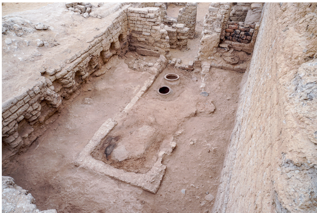
Fig. 4 - Vista della sala da banchetto D in ST 224.

colo d.C.), cesti di varie dimensioni, vasellame in ceramica, con una cospicua presenza di ciotole, bicchieri, brocchette, anfore oltre alle due grandi giare per lo stoccaggio di liquidi e cibi solidi. Una di queste due giare è decorata con una testa di vacca a rilievo. Tra i papiri rinvenuti vi sono amuleti, costituiti da piccoli rotoli sigillati, e altri a contenuto documentario. Oscilla in faïence raffiguranti Bes, parti di statuine in terracotta di Harpocrate, Afrodite e Baubo provengono principalmente dalla sala da banchetto, mentre una zampa di rapace con cordino di sospensione era nella cantina B. Nella sala da banchetto D sono state rinvenute tre delle quattro statuette in argilla oggetto di questo studio.